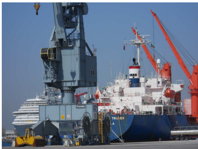
Le foto sul presente foglio sono state scattate su autorizzazione Capitaneria di Porto n 12/2012 del 26/03/2012

Questo comporta ovviamente le necessità di ricercare ulteriori canali ed iniziative per sostenere l'attività della Stella Maris Monfalcone.